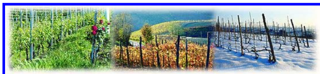
Vigneti di Barolo