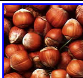
IGP Nocciola del Piemonte -->